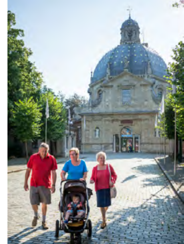
Regionale producten in het Infokantoor van Tienen; paardentuig in het Suikermuseum in Tienen; de basiliek van Scherpenheuvel

Vlaams-Brabant is samen met Waals-Brabant de jongste provincie van België, maar kent als onderdeel van het hertogdom Brabant een lange geschiedenis. Bij de stichting van het Verenigd Koninkrijk der Nederlanden viel Brabant uiteen in drie provincies: Noord- en Zuid-Brabant en Antwerpen. Na de afscheiding van België in 1830 kreeg Zuid-Brabant de naam Brabant. In 1995 werd de provincie gesplitst in Vlaams- en Waals-Brabant en het Hoofdstedelijk Gewest Brussel.