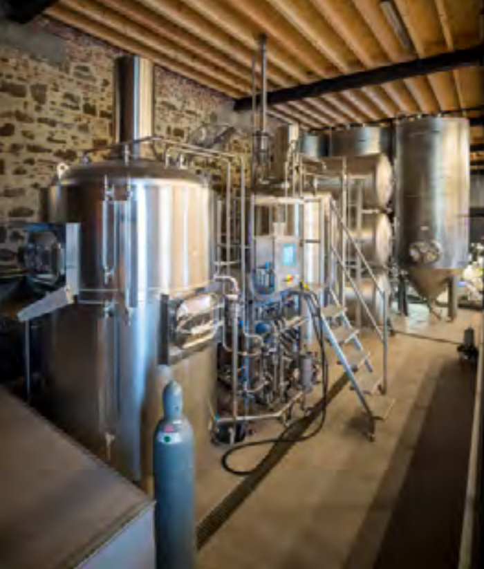
Boven: huisbrouwerij in abdijcafé Het Moment in Averbode; stadhuis en lakenhal Zoutleeuw; onder: Begijnhof Diest; sacramentstoren in Zoutleeuw