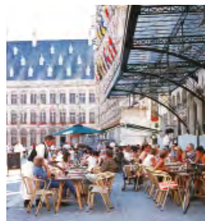
Vier keer Leuven: het Begijnhof, het Stadhuis en terras op de Grote Markt en gotische pinakels op het Stadhuis

Hageland mag dan minder bekend zijn als toeristische bestemming, het is wel een streek die met zijn charmante stadjes, historie, beboste heuvels en Hagelandse smaken, niet onder doet voor de bekendere streken als Haspengouw, Kempen en Voerstreek. <